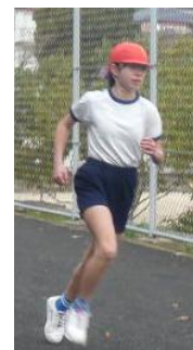
【マラソン大会 上位入賞者（敬称略）】