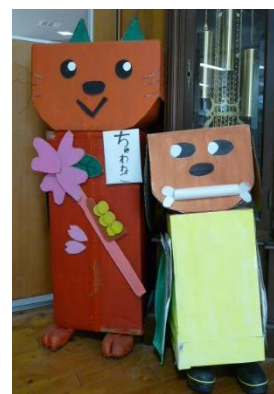
6年生が作成した ちやわ犬(右)