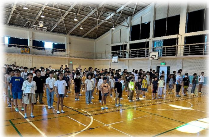
校歌を元気に歌っている様子

2学期が始まり、学校に呼子っ子の元気な声もどってきました。8月26日(月)から登校していて、今週より給食も始まり、本格的にスタートしました。久しぶりに会う子どもたちの中には、「身長がぐんと伸びたね」と一目で分かるほど、大きくなっている子もいました。始業式では、長い夏休み明けにもかかわらず、静かに姿勢よく話を聴くことはもちろん、話し手をしっかりと見て、頷いたり返事したりでき、素晴らしかったです。相手の目を見て頷いたり反応したりして聴くこと、これからも大切に続けてほしいです。