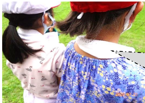
唐津市から一人に1個いただいた「クールタオル」登下校や授業中に使って、少しでも涼しく過ごせるといいですね。記名を忘れずに！