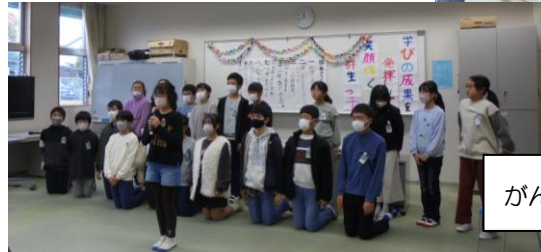
がんばった集会委員会