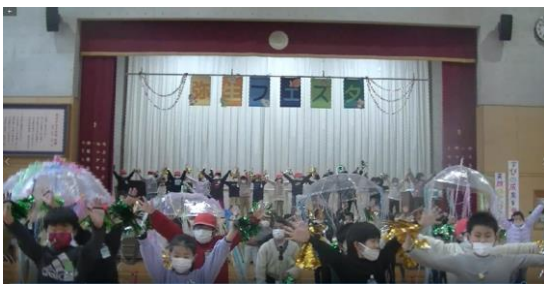
2年生：「スイミー」音楽劇 合奏