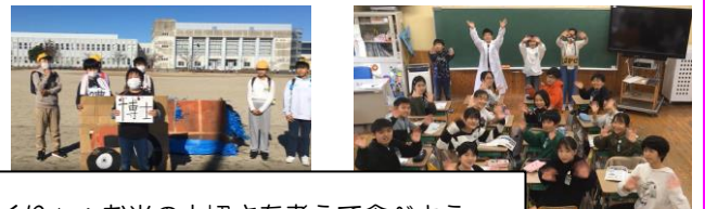
5年生：「米づくり」：お米の大切さを考えて食べよう