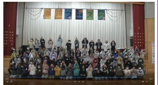
4年生：福祉について、手話「小さな世界」（日本語、英語）