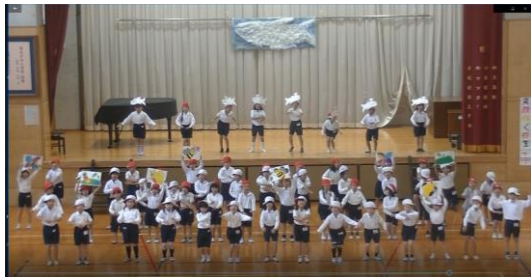
1年生：「くじらぐも」、歌「手のひらを太陽に」（手話）