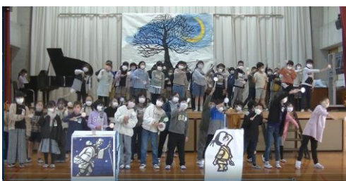
3年生：「モチモチの木」朗読劇