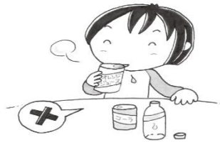
あま甘いものばかり飲（の）まない