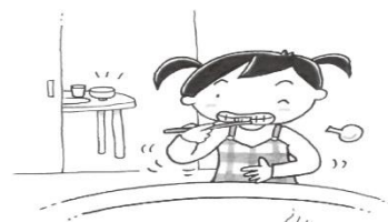
食（た）べたら歯（は）み（み）がきをする