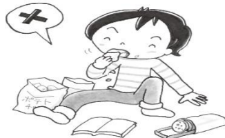
だらだら食（た）べない