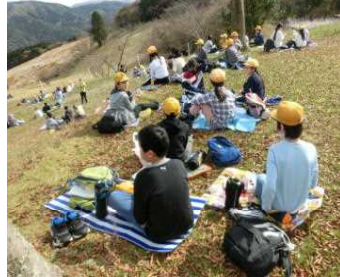
【手作りお弁当でピクニック】

今年の宿泊体験学習は、5月から11月への延期、貸切可能な施設への変更などを余儀なくされる中での実施となりました。ご理解・ご支援のお陰で無事に充実した一泊二日を過ごすことができ、貴重な経験もたくさんできました。