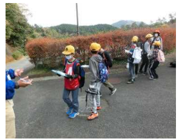
【みんなで協力、ウォークラリー】