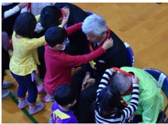
全学年 地域の方への感謝の会

地域と学校の連携・協働を推進するため、地域の人的な資源を積極的に学校教育に活用していくことで、学校と地域の連携を深め、学校への理解や信頼を高め、地域とともにある学校づくりを推進していきます。