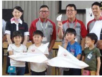
2年 JAL折り紙ヒコーキ教室