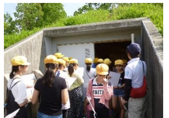
6年 弥生が丘地区史跡巡り