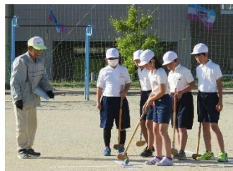
4年 グラウンドゴルフ