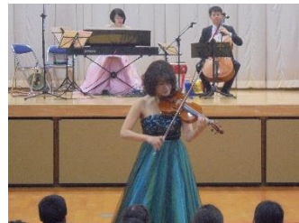
4年 アウトリーチ訪問演奏