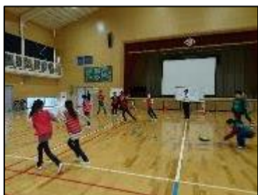
若葉小学校 6年生の児童より

11月に田代中学校で「なかよし交流会」がありました。ドッジビーをして楽しかったです。来年から中学生です。文化祭やいろいろな行事があるそうです。少し不安だけど楽しみにしています。