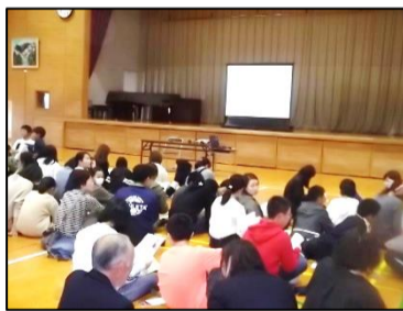
田代中学校 2年生の生徒より

新入生説明会の学校紹介ビデオ作成で、改めて田代中学校の良さを知ることができました。生徒会で協力して作成しました。小学校には行けませんが皆さんに喜んでもらえたでしょうか。