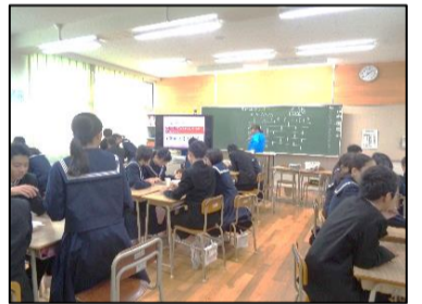
田代中学校 2年生の生徒より

授業で礼儀作法や和食などについて学びました。日本の伝統的な振る舞いや日本食の良さを体験することによって、日本文化のすばらしさを感じることができました。