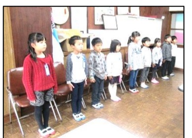
田代小学校 1年生の保護者より

正しい姿勢や言葉、正しい物事を教わる授業って素晴らしいと思います。家で、「敷居を踏んだらだめだよ」と礼儀作法について話している姿を見て感心します。いろんなことを学んでいるんですね。