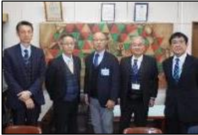
田代中校区の校長、副校長

令和2年2月18日(火)に、今年度の小中一貫教育の在り方について、田代中校区の4小中学校の校長、副校長、教頭等が一同に介して、研究推進協議会を開催しました。