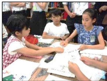
弥生が丘小学校 5年生の児童より

ちょっとでこぼこな形の体積を求めることはできたけど、その形にどうやって分けたのか、どうしてその計算をしたのか、友達に説明するのは難しかったです。もっと勉強したいと思いました。