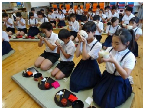
若葉小6年生 茶道の授業の様子