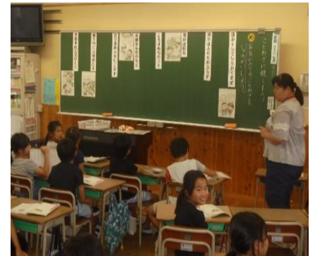
弥生が丘小3年生 ことわざの授業の様子

2年生では、自分で集めた言葉を使い、オリジナルのかるたの読み札を作りました。自分が作ったかるたを音読したり、友達の作ったかるたの言葉あてクイズをしたりする中で、言葉の面白さやかるた独特の言葉の響きやリズムのよさに気付いていました。