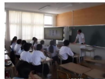
田代中1年生 俳句の授業の様子