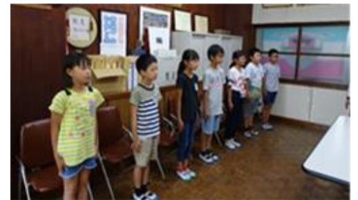
田代小学校5年生 マナー教室

「マナーとは自分の思いを相手に伝えること。」子供たちがマナーの大切さを知り、より良い人間関係を築くことを目指しています。第1回目の今回は、田代小『目指す子ども像』4つの中から「どんな子どもになりたいか」とその理由をたずねました。どの学年も、あいさつや質問への受け答えがしっかりしていて感心しました。第2回目は、1月に実施します。子供たちのさらなる成長が楽しみです。