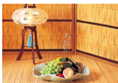
田代中3年生 資料写真「室礼」