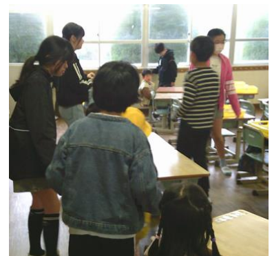
1年生のお世話をする6年生

新1年生が入学して以来、上級生の子ども達の関わり方が素晴らしいです。朝、児童玄関内で1年生の登校を待って、教室まで連れて行ったり、教室でランドセルから道具を出して準備を手伝ったり、給食準備を一緒にしたり、昼休みに遊んだりしています。その様子を見ると微笑ましいですし、上級生が1年生のお世話をすることで、お兄さん、お姉さんとしての自覚と思いやりが育っています。4月28日には、歓迎集会や歓迎遠足があります。それ以降も1年生との関りが末永く続く山内西っ子であってほしいと思います。毎朝、子ども達が唱えている、山内合言葉「やさしいことばを、まわりの人に、うれしいえがおで、ちかづくみんな」を実践していきたいと考えています。