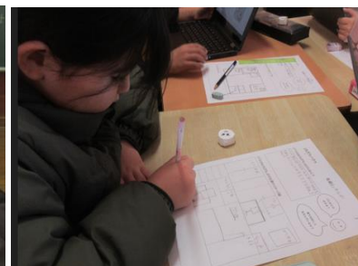
岡本先生や教科書の参考作品をヒントにして、イメージを広げていました。