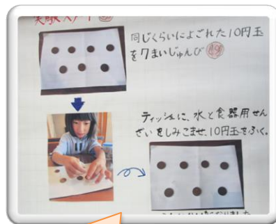
実験の様子が伝わるように写真を入れて説明しているので、わかりやすいですね。