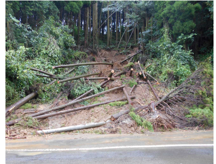
【土砂崩れ:犬走方面の道路付近】

また市内では、北方町、朝日町、橘町の冠水被害が大きく、北方小・中、朝日小、橘小は30日(金)も休校でした。予報では、今週も雨が降りそうです。子どもたちの安全確保のため、今後も雨の降り方には十分気をつけていきたいと思えます。