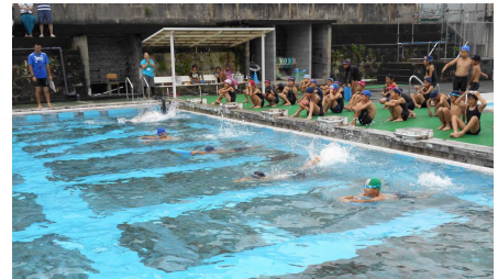
【4年生の学級対抗リレー】

昨年度から1週間短い、8月25日までの36日間の夏休みになっています。しかし、宿題はたくさん出ています。宿題は、一度にははかどりません。毎日、コツコツと取り組ませてもらえれば有り難いです。それともう一つ。夏休みが子どもの成長の糧となる時間になるよう何か一つ継続して取り組むように声をかけてあげてください。自由研究、読書、水泳、お手伝いなど子どもが取り組みやすいものをぜひ。今朝の全校朝会では、以下の話をしました。