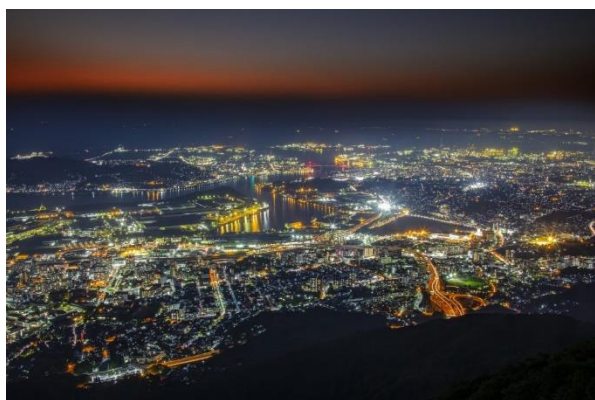
2023 日本新三大夜景都市「皿倉山」