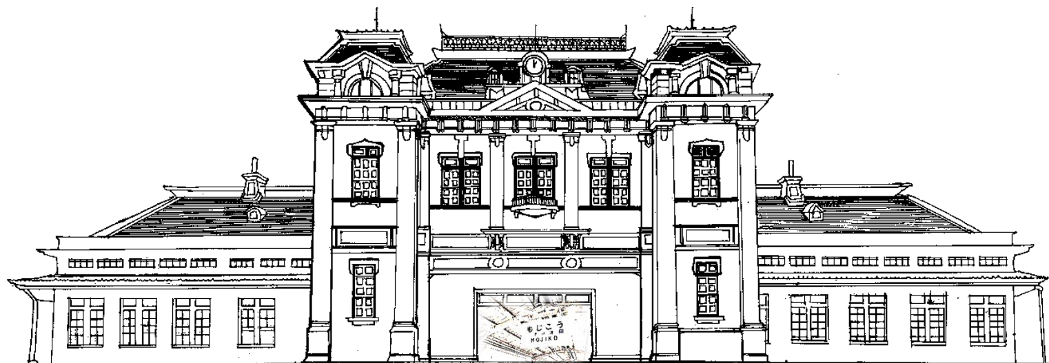
国指定重要文化財：門司港駅（旧門司駅）本屋