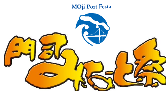
日本三大みなと祭「門司みなと祭」