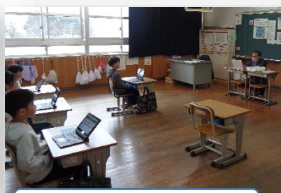
2年:タブレットを使って算数