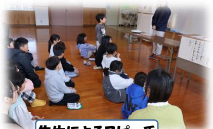
先生によるスピーチ

本校の伝統にもなっている佐代川タイム(スピーチタイム)ですが、今年度も様々な形式を取りながら子ども達の話す力、聞く力の育成に取り組んできました。通常は各学級で実施していますが、先日は、『教師によるスピーチ(聞き役は児童全員です)』『6年生が発表する全校佐代川タイム』を実施しました。