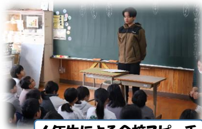
6年生による全校スピーチ