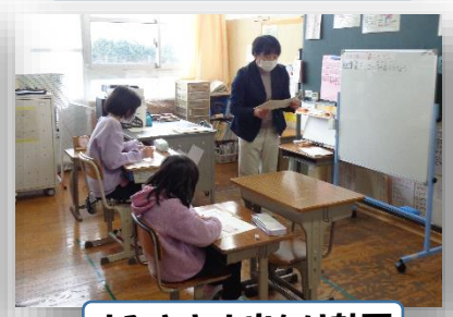
おひさま:お出かけ計画

教育講演会では肥前精神医療センターの看護師の方より「ゲーム脳って」という題で講話をしていただきました。ゲームによる依存の影響やその予防、SNSを使う際の配慮事項などについて話されました。中でも「ゲーム、スマホ以外に楽しみ(体験・経験)を見つけてやってみる」ということが印象的でした。「山代っ子の約束」の中にも同じようなことが挙げられています。ご家庭でも是非話し合ってください。