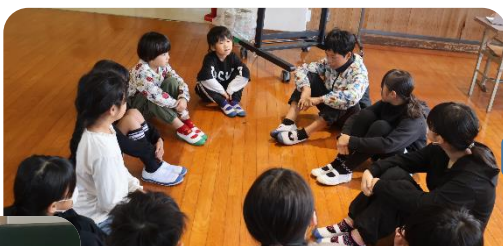
グループごとの話し合い