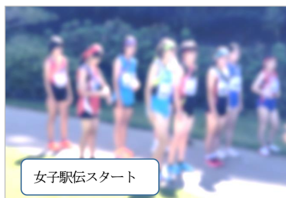
女子駅伝スタート