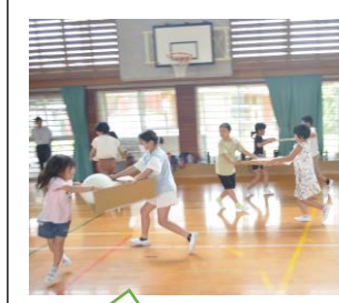
3年生企画 「ボール段ボールリレー」