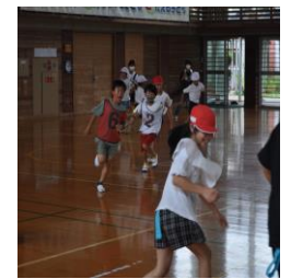
5年生企画 「しっぽとりゲーム」