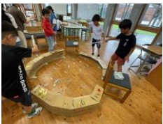
魚の図鑑のイラストを使った釣りゲーム