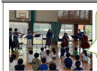
静かに演奏に 聴き入る子ど もたち。