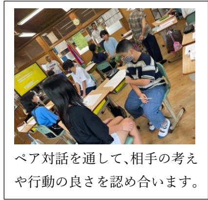
ペア対話を通して、相手の考えや行動の良さを認め合います。