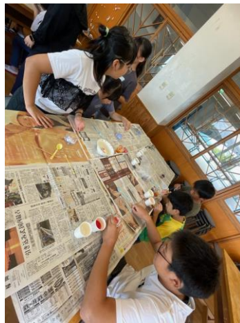
「グラスサンドアート」づくり

名護屋城博物館では、歴史を学び、学芸員さんの説明に真剣に耳を傾けました。話の聞き方やマナーがよいと褒めていただきました。