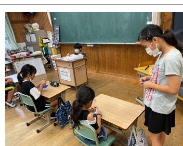
平和への願いを込めて。