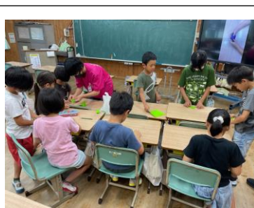
協力して折り鶴に挑戦。