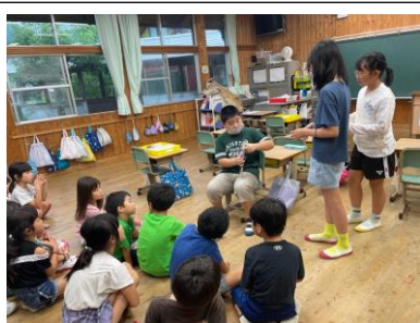
児童による読み聞かせの様子。

平和教育週間として毎年、夏の時期に取り組んでいます。そもそも平和教育は、年間を通して、日常的に取り組むものだと考えます。特に夏は、過去の歴史もふまえて、学習に取り組み、伝えていく必要があります。今月中旬には、6年生が縦割り班活動の中で、「折り鶴」の作り方を下級生に教えたり、放送・集会委員会の児童が、各教室で平和に関する本を読み聞かせたり放送でクイズを出したりして、児童同士で学び合う取組もありました。