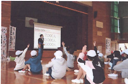
まずボッチャ・国スポ・全障スポの話听取了きました

11月16日（水）にボッチャ体験がありました。これは2024年に佐賀で開催される国スポ、全障スポに向けて佐賀県が行っている取組です。普段、あまり体験する機会の少ないボッチャに子どもたちは楽しそうに取り組んでいました。この取組で子どもたちの国スポ、全障スポへの関心がさらに高まったようです。