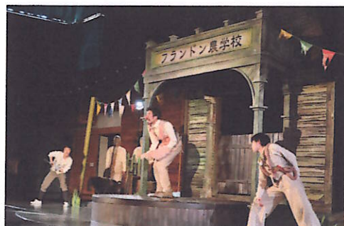
「食べる」とは何か。演劇を通して子どもたちは真剣に考えていました