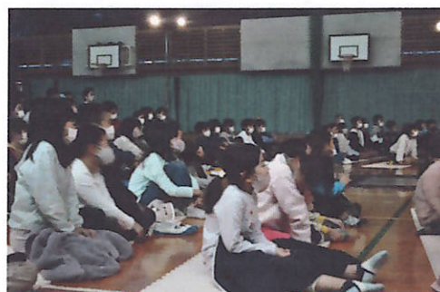
子どもたちはプロの演技に見入っていました