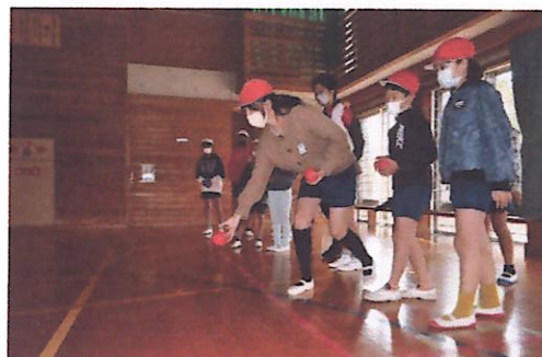
目的の場所に投げるのはなかなか難しそうです