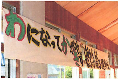
職員室前廊下に掲げたスローガン

23日（日）に開催される運動会のスローガンは「 わ になって か がやけみんな き ずなふかまる運動会」になっています。スローガンの中に「わかき」の文字が入っているのがポイントです。練習はすでに13日（木）から始まり、14日（金）には結団式が行われ、応援合戦の練習も始まりました。高学年の児童が中心になって行われる応援合戦、運動会の最大の見せ場です。みなさん楽しみにしておいてください。