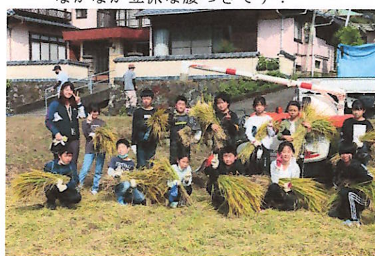
最後にみんなで「ハイ、チーズ！」

23日（日）は運動会です。もし当日、天候等で延期など日程に変更がある場合、 6:30 までに学校メールにてお知らせいたします。学校メールでのお知らせがない場合は、通常通りの実施となります。もし、延期となった場合は、24日（月）に実施し、25日（火）が代休となります。