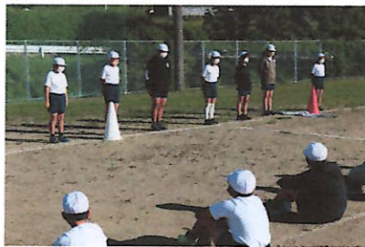
結団式で気持ちが一つになりました