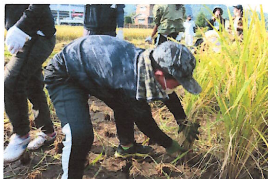
なかなか立派な腰つきです！