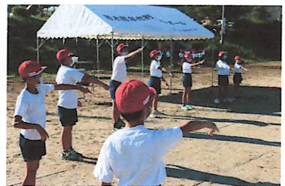
高学年の指導で応援練習をしています