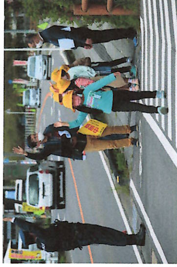
横断歩道は手をあげて渡ろうね！

4月12日(火)に交通安全教室が開催されました。1、2年生は学校周辺を歩きながら歩道の歩き方や横断歩道の渡り方などを学びました。3～6年生は運動場で自転車の安全な乗り方の練習を行いました。当日は交通指導員さん、駐在さん、武雄警察署や市役所の方が指導に来ていただきました。若木町には交通量の多い道路があり、子どもたちの交通事故が心配される所です。交通安全教室で学んだことを生かして、子どもたちには安全な歩行や自転車乗りを心がけてもらいたいですね。