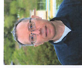
ALT メット アイドゥン