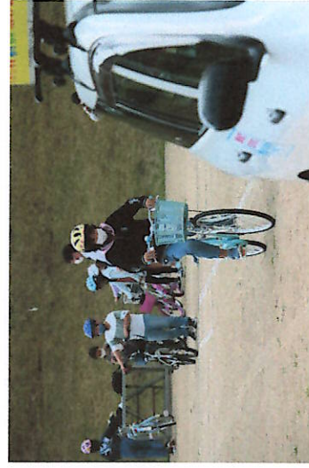
自転車に乗るときはしっかりと安全を確かめて