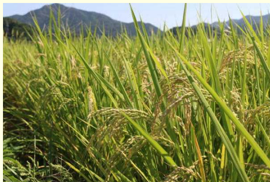
田んぼの稲は穂を垂れています