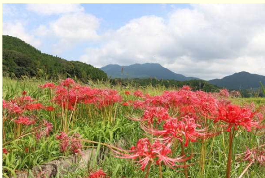
田んぼの彼岸花がきれいです

朝夕は涼しくなり、秋の訪れを感じられるようになりました。学校の周りで秋を見つけました。