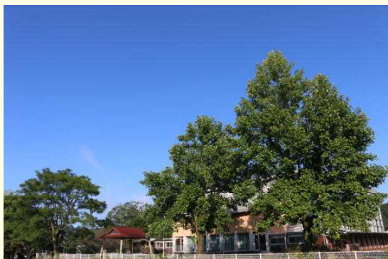
空は高く、ぬけるような青さです