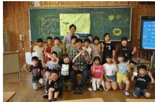
最後に記念写真を撮りました（3年）