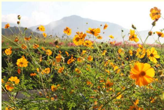
キバナコスモスが秋の日に照らされています