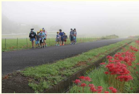
霧のカーテンの中を子どもたちが登校してきます