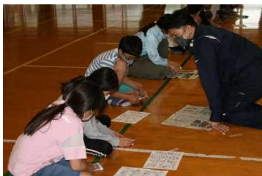
新聞紙でスリッパを作っています

日本は地震、台風、火山噴火など自然災害が多い国といわれています。災害はいつ起きるかわかりません。日頃からの備えが大切です。すでに梅雨入りをして、しばらくは雨の多い時期が続きます。武雄市では一昨年、大規模な水害に見舞われ、多くの方が被害に遭いました。学校では毎年、災害に備えて防災教室を開催しています。今年も5月17日（月）に市の防災減災課の方に来ていただき防災教室を開催しました。6年生は体育館でお話を聞いた後、災害に備えた実技を行いました。感染対策のため、6年生以外の学年は各教室でリモートを使いその様子を見ました。今年も、災害が発生しないことを祈りながらもしっかりと備えはしていきたいですね。