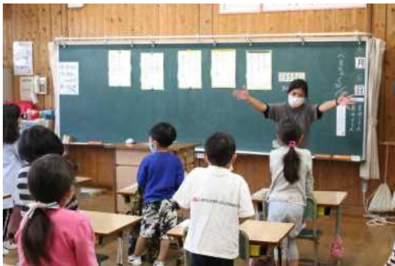
1年生も元気いっぱい取り組んでいます

新型コロナウイルスの感染が落ち着いて、早く支援員の皆様に来ていただけるといいなと思っています。