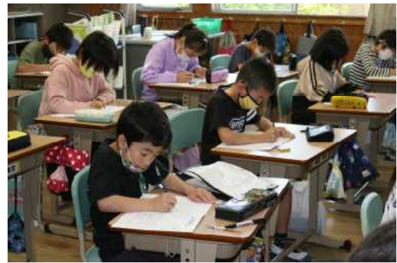
みんな集中しています！