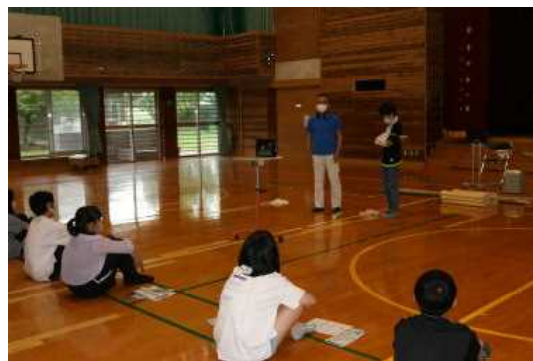
けがの応急処置なども学びました