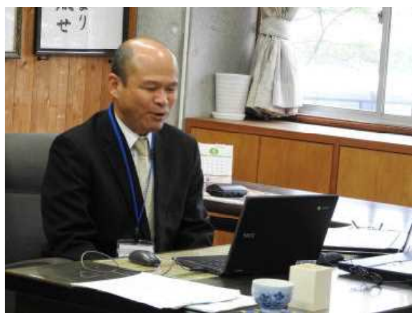
校長室でパソコンに向かって話をしています はじめての経験でけっこう緊張しています。

児童の接触を避けるために、集会等をリモートで実施する学校が増えています。本校は小規模校ということもあり、全校朝会をリモートで実施したことはありませんでしたが、市内でも新型コロナウイルスの感染者が確認されていることから、4月28日（水）の全校朝会はリモートで行いました。初めてのリモートでの実施ということで、話をする先生は少し緊張気味でしたが、子どもたちは教室で、電子黒板を見ながらしっかりと話を聞くことができました。新型コロナウイルス対応だけでなく、インフルエンザの流行時期等にもリモートでの集会は感染予防に有効です。今後も状況に応じて実施できればいいと思います。