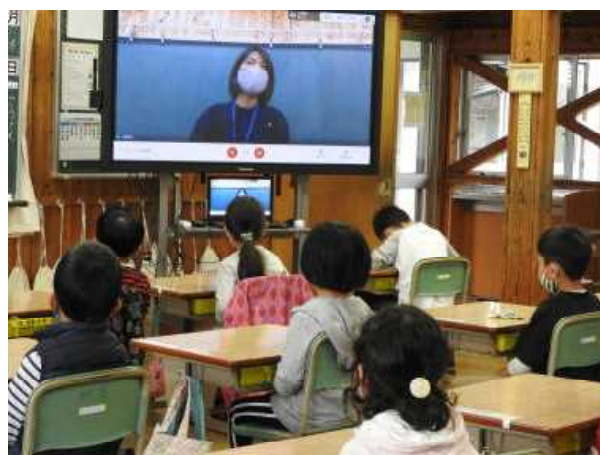
各学級では、電子黒板を見ながら真剣に先生の話を聞いています。