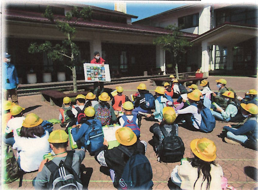
↓ 1日目、フィールドビンゴの事前説明です。

また、10/7(水)~8(木)の5年宿泊体験学習でも、5年生の大きな成長を感じました。慣れた学校、そして親元をばし離れて、不便な1泊2日の生活をしました。初日のフィールドビンゴでは、4時間半の活動時間を仲間と協力して歩き回る姿がすばしかったです。そして他の団体の方や職員の皆様への挨拶が上手で、たくさんはめられました。2日目は、粉からのピザ作りに協力して取り組み、後片付けまで気持ちを切らさず、粘り強くやり遂げました。これらの体験を基に、今後最上級生としてがんばっていくだろうと、近い将来の姿が(のほほ)