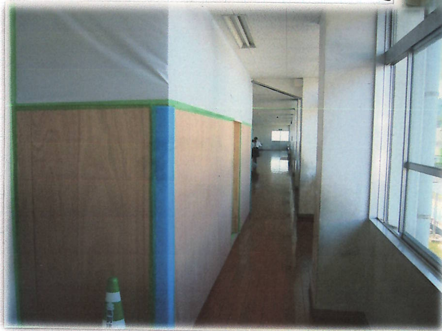
↑ 4・5年教室に入る間際の北棟トイレ出入口付近。

→ しています。学習中に工事の音が聞こえてきますが、学習に支障をきたすほどではありません。ただ、トイレと壁1枚を隔てた階段を通るときは、大きな音や振動を感じま