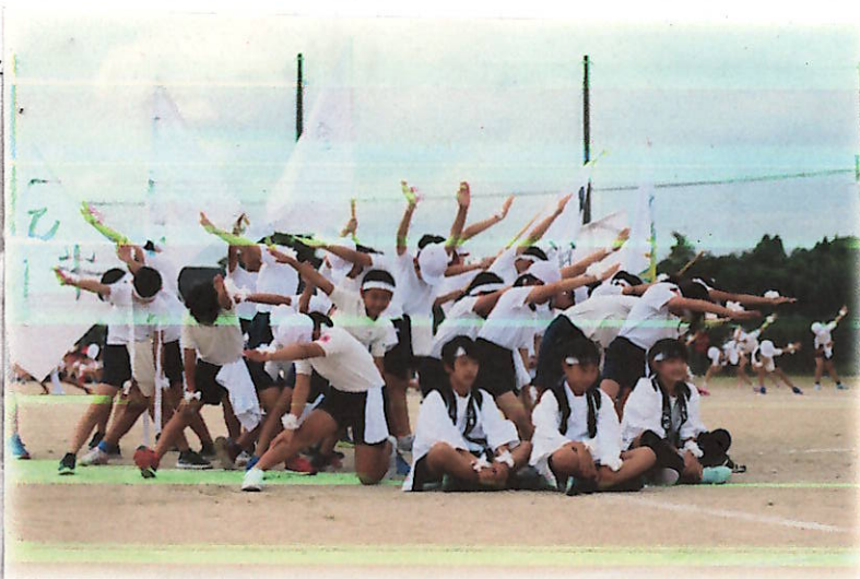
↑ ↓ 見事なまとまりを披露した応援合戦。

9/26(土)の運動会には、ご家族の皆様にご多数おいていただき、誠にありがとうございました。コロナ禍の中での開催ということで、受付でのチェックリスト提出、地区テントなし、午前中開催、プログラムの縮小と、これまでとずいぶん違う形での行事となりましたが、皆様のご協力のおかげで子供たちの成長した姿を見ることができました。やはり、大勢の方に見守られた活動は気が張るので(よう)、子供たちは誇らしげに、いつこ