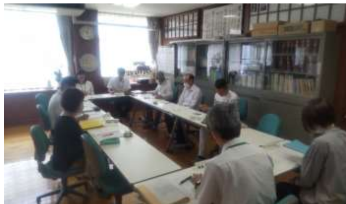
【第 1 回学校運営協議会の様子】

今後は、学校運営協議会としてどのような活動をしていけばよいか、また、学校運営にどのように関わっていくのか等について、若葉小学校の特色を考えながら話し合いを行い、連携・協働の視点から進めていくことができたらと考えています。昨年度は地域の皆様のご協力のもと、たくさんの学習支援をしていただきました。今年度も、ご理解・ご協力を、どうぞよろしくお願いいたします。