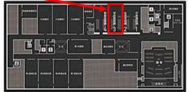
【鳥栖市役所3階フロア図】