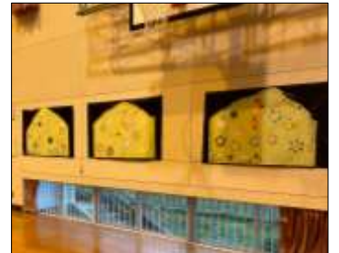
4年生が作った飾り