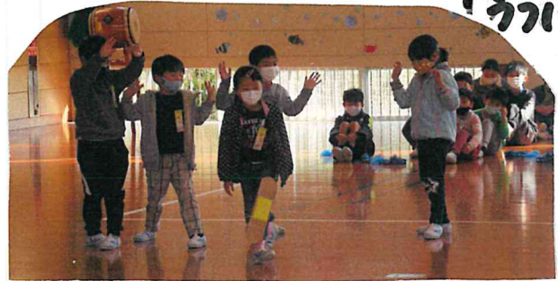
「うたの木 おき お見」