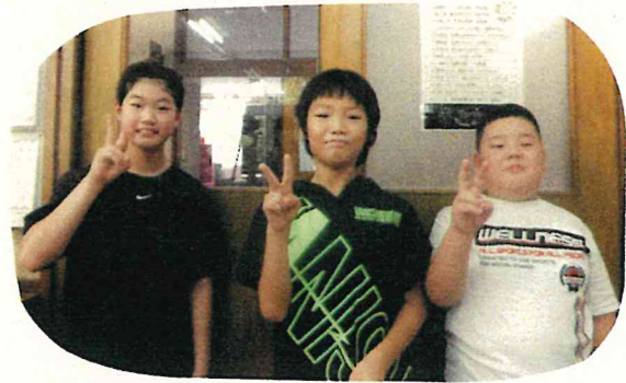
みゆ・しゅう・しのすけ

ペアの人と協力してなかよし はんの団結力がもっと深まる ような競技内容を考えました。 1年生にも分かりやすいように 説明をします。