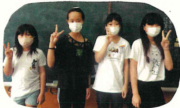
れいな・くるみ・さき・るき