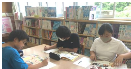
6年キャリア教育 将来の夢について考えよう

6月は読書週間。図書館では子ども達が楽しそうに本を借りたり読書をしたりする姿が見られます。また、授業で学んだことを確かめ、広げ、深める、資料を集める、自分の考えをまとめて発表するなどの学習活動もさかんです。テーマに沿って図書館の本を自分で選び、調べたことをワークシートにまとめることで主体的に学びを深めています。