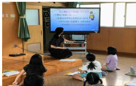
3・4年 インタビューの技を学ぼう

簗木小学校では各学級に1台ずつ電子黒板を設置し、デジタル教科書やパワーポイントの資料など視聴覚教材を活用しながら学習しています。子ども達は視聴覚教材によって言葉と図や絵を結び付けて理解を深めたり、映し出された教材に線を引いて自分の考えを説明したりしながら学習に取り組んでいます。