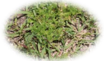
メリケントキンソウ

南米原産の外来種で果実にトゲがあり、はだして走り回る子どもたちのけがの原因になりうる