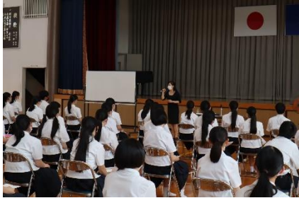
【外部講師による進路講話】

7月1日から高卒の求人票が公開され、本格的な就職活動がスタートしました。放課後の進路指導室には、企業や進学先の情報収集や質問、応募前見学、オープンキャンパスの参加など、3年生を中心に多くの生徒が訪れています。授業では、3年生を対象に外部講師を迎えて、進路講話や進路保障の学習を行いました。心構えから礼節指導についての学習に加え、公正な採用選考について考え、対応を学ぶこともできました。これらを生かして、それぞれが夢の実現に向けて全力で取り組むことを願っています。(※3年生の約4割が就職、約6割が進学を希望しています。)