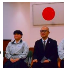
アビリンピック結団式