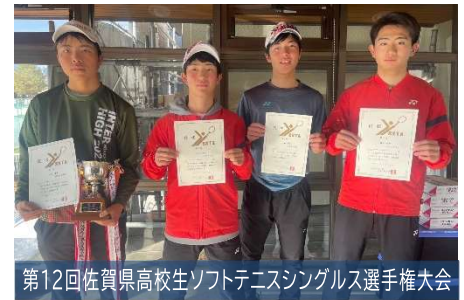
第12回佐賀県高校生ソフトテニスシングルス選手権大会