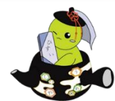
オリジナルキャラクター「茶嬢ちゃん」