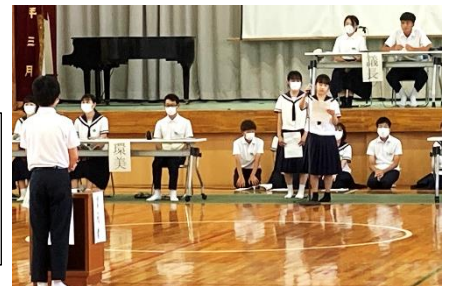
【質問に答える生徒会担当】

いろいろな意見に対して丁寧な質疑応答がなされた生徒総会でした。今後の生徒会活動によって、学校行事に限らず、普段の学校生活が「和気合愛（生徒会スローガン）」となることを期待しています。