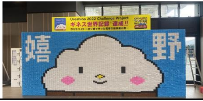
【嬉野温泉駅の展示物】