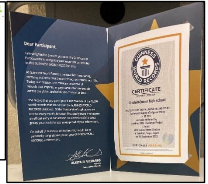
【ギネス公式認定証】

嬉野温泉駅前の「うれしのまるく i」で、ぱらぱら動画を流していました。受付の方が、「よくできていますね、立ち止まって見ている方も多かったですよ」と褒めていましたので、まずまずの反響ではなかったかと思います。