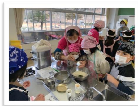
ヘルスマイトさんと楽しく作りました