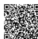
児童の情報端末使用 1/11(火)メ切

今年もコロナの心配からスタートしましたが、保護者・地域の皆様のご理解とご協力のおかげで、主要な行事を無事実施することができました。心より感謝もウシ上げます。