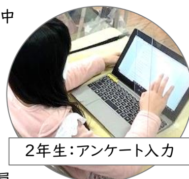
2年生:アンケート入力

まずはアンケート2件の Web 回答について、よろしくお願いします！ めざせ100%!!