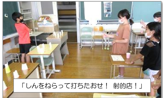
「しんをねらって打ちたおせ！ 射的店！」