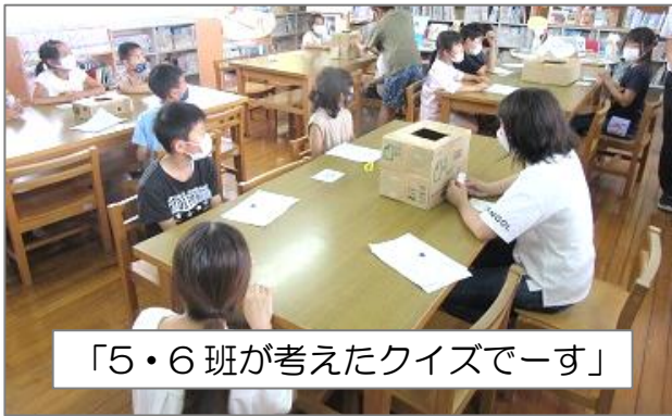
「5・6班が考えたクイズです」