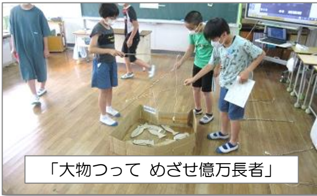
「大物つって めざせ億万長者」