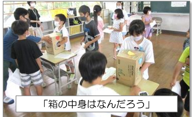
「箱の中身はなんだろう」