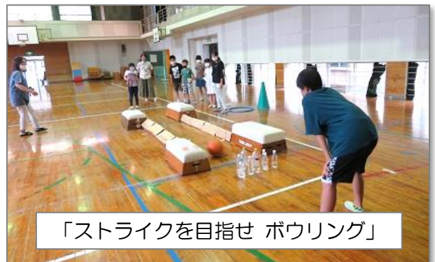
「ストライクを目指せ ボウリング」