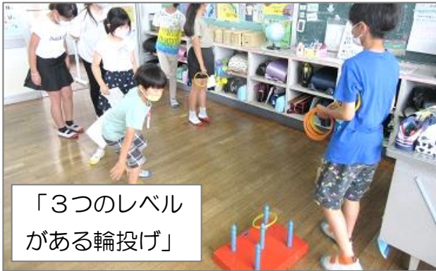
「3つのレベルがある輪投げ」