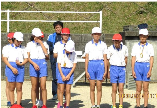
【メダリストの表彰】