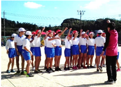
【6年生のスタート、がんばるぞー！】