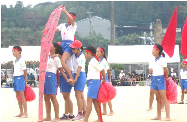
【勝利の女神が微笑んだ赤組応援団】

子どもたちは、気持ちを切らさず『輝けみんなの笑顔 燃えろみんなの闘志 令和初 打上小運動会』のスローガンのもと、6年生を中心にしっかり自分のベストを尽くすことができました。この頑張り、これからの生活に生かされていくと思います。