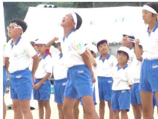
【惜しくも5点差で涙をのんだ白組応援団】