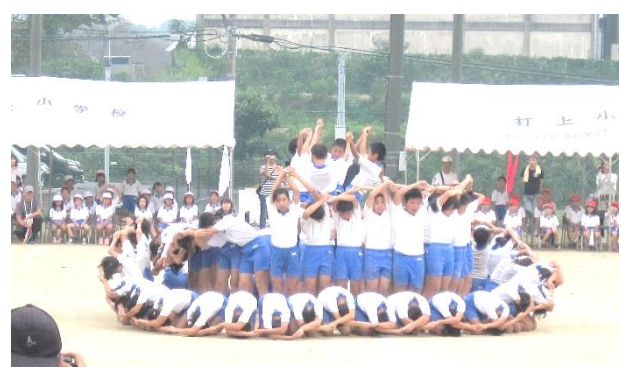
【感動をよんだ4～6年生のスタッツ】

※ 運動会の動画や写真は学校において公開しています。行事等でご来校の際にご覧ください。