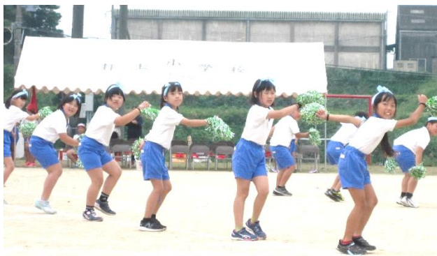
【かわいい1～3年生のダンス】