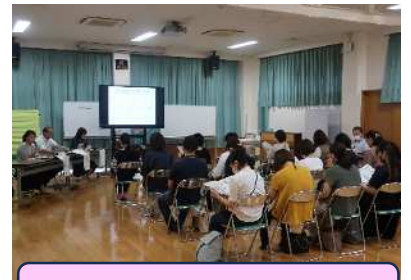
10/8 中原特別支援学校での説明会

A12 各校舎にエレベーターを設置しており、車の乗降場所もあります。玄関の段差はありません。ただし傾斜はあるため、職員がサポートする形になると思われます。