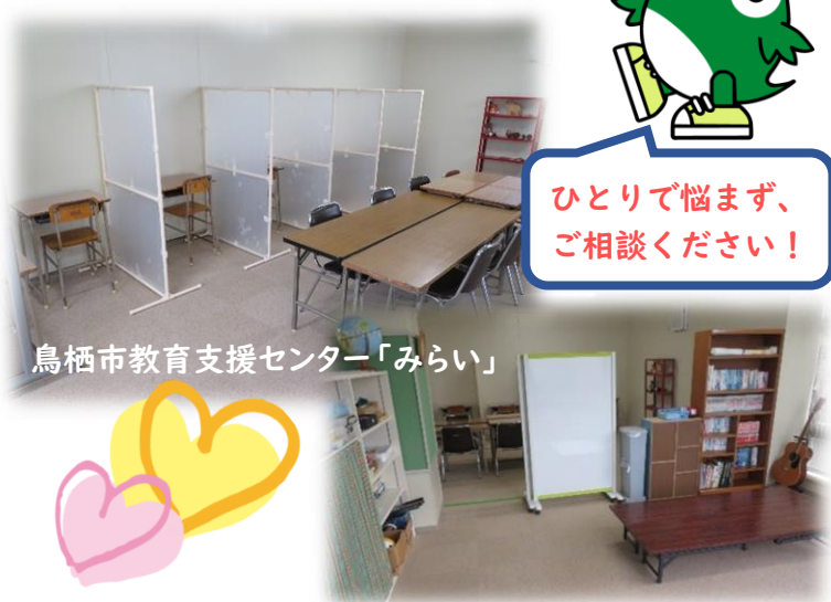
鳥栖市教育支援センター「みらい」